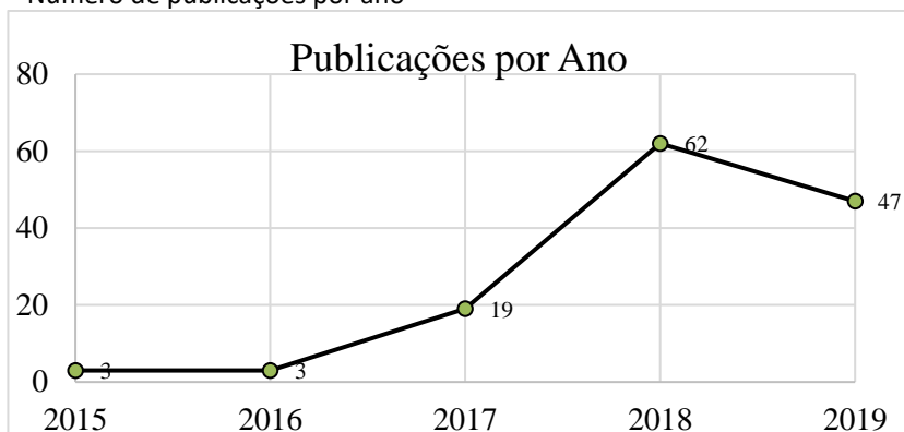
Figura 1 – Número de publicações por ano

empresariais voltadas ao elemento social e ambiental. O crescimento se deve à importância que o tema tem demonstrado, primeiramente ao ser adotado como política nacional pelo governo chinês para promover a economia circular, por meio de uma série de leis e regulamentos (STAHEL, 2006) e recentemente com várias regulamentações e propostas, sobretudo no contexto chinês e europeu (WHALEN, 2019; QU et al. , 2019). O Figura 1 demonstra a evolução do número de publicações, conforme os anos.