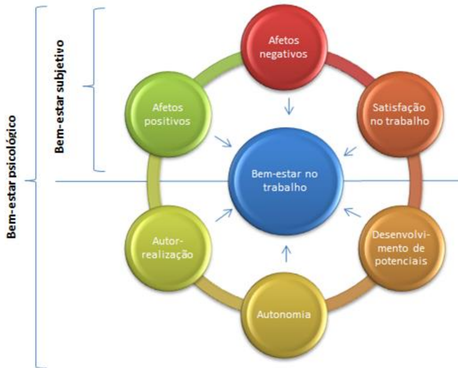
Figura 1 – Fatores que influenciam o Bem-estar no Trabalho