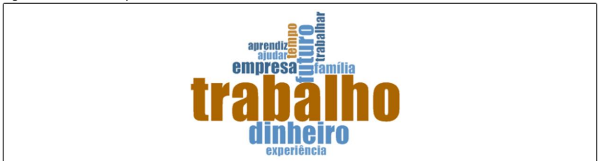
Figura 1 – Nuvem de palavras