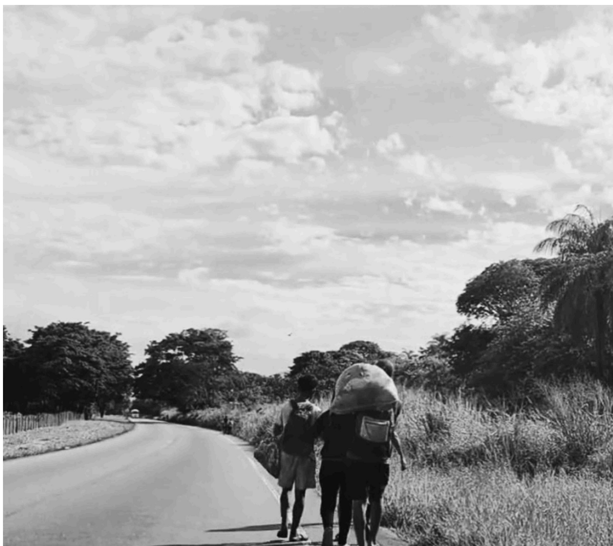
Figura 1 – Foto “Caminantes”, San Antonio del Táchira, Venezuela, 14 de agosto de 2021.

Según datos del Observatorio Venezolano de Migración en la región, la gran mayoría de migrantes ha llegado a Colombia y Perú. Colombia acoge a 2.477.588 millones de migrantes y Perú, 1,49 millones. Los otros vecinos de Venezuela son Brasil y Guyana, que han recibido 388,1 mil y 19,6 mil personas, respectivamente. En el caso de Norteamérica, Estados Unidos reporta la mayor cantidad de migrantes venezolanos (465.200), mientras que a México han llegado 102.223 y a Canadá, 22.400 (OVM, 2021).