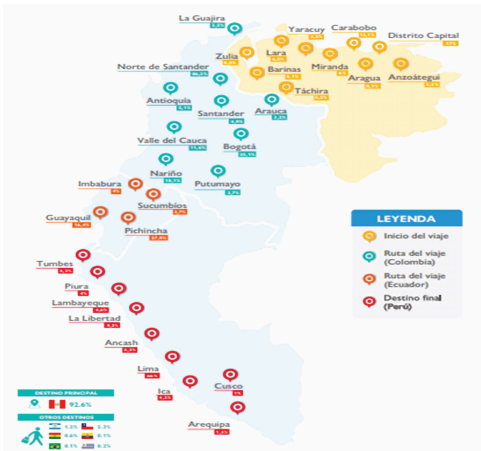
Figura 2 – Mapa de Rutas migratorias de los caminantes.

Respecto a Perú y su dinámica migratoria, cabe mencionar que dicho país ha sido un recurrido destino migratorio en el pasado, sin embargo, la llegada de población migrante declinó a lo largo del siglo XX. A su vez, entre 1980 y 1996 la inestabilidad económica y la violencia asociadas al conflicto armado interno en Perú fueron causantes de una importante emigración de peruanos hacia, mayoritariamente, “Europa (España, Francia e Italia), Estados Unidos, Japón, y Sudamérica (Venezuela y Argentina)” (SANTANDER, 2006, p. 198). Por su parte, el incremento de la inmigración extranjera en los últimos años, de una u otra forma responde al crecimiento económico que viene experimentando el país. Según los datos reportados por Naciones Unidas, para el año 2019 se estimaba que Perú contaba con un total de 782, 169 personas migrantes que residen en el territorio, de las cuales 863,613 eran provenientes de Venezuela. Este dato