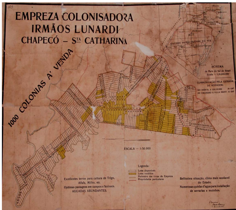
Figura 3. Área de terras da subcolonizadora Irmãos Lunardi (Déc. 1930)