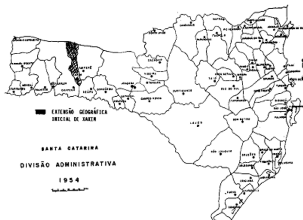
Figura 1. Município de Xaxim (1954)