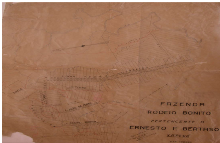
Figura 2. Mapa da fazenda Rodeio Bonito (1920)