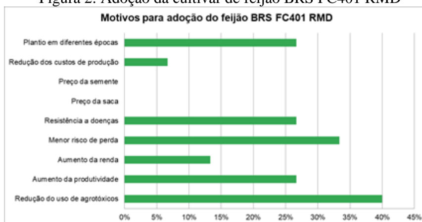
Figura 2: Adoção da cultivar de feijão BRS FC401 RMD

Os resultados encontrados estão em conformidade com os estudos de Zilberman, Holland e Trilnick (2018).