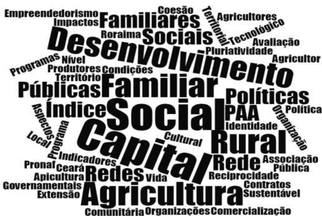
Figura 1 – Nuvem de palavras chave

eixo a importância do Capital Social para o desenvolvimento da Agricultura Familiar e o meio rural.