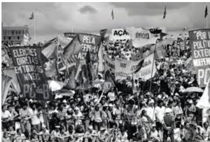
Figura 2 – Movimentos sociais na década de 1980

Trabalhadores Rurais Sem-Terra (MST), a Central Única dos Trabalhadores (CUT), o Partido dos Trabalhadores (PT) e o movimento das “Diretas já!” são alguns dentre os protagonistas desse período.