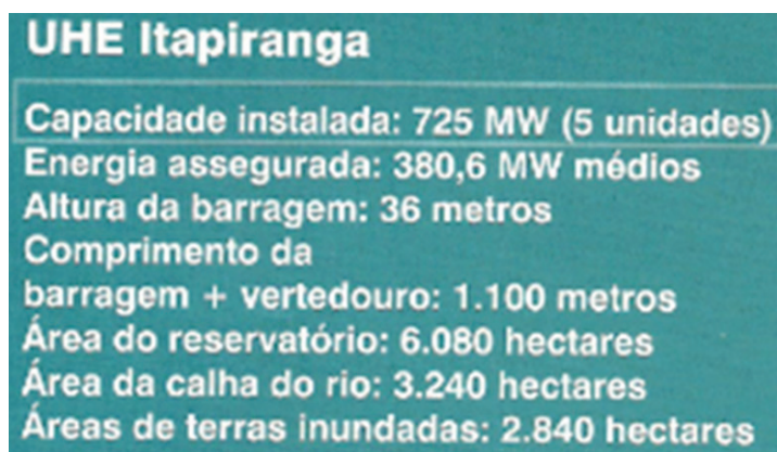
Figura 3 – Recorte da cartilha de apresentação da UHE

Atualmente, com seu projeto apresentado pela Engevix, em 2004 a barragem de Itapiranga apresenta as seguintes dimensões técnicas: